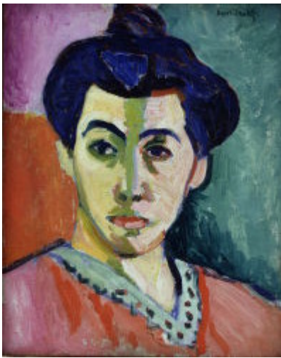
Georg Baselitz (f. 1938), Crema, 2004, engrasan en la lona Pablo Picasso (1881 - 1973), Mujer Desnuda que queda por la Ventana, 1971, lápiz, red y tiza azul Asger Jorn (1914 - 1973), Colorete de Visión (las Visiones Rojas), 1944, engrase en la lona Amedeo Modigliani (1884 - 1920), Alice, 1918, engrasa en la lona Georges Braque (1882 - 1963), Arbres (Los Árboles al l'Estaque), 1908, engrase en la lona André Derain (1880 - 1954), La danseuse ou la femme en camisa (la mujer en la camisa), 1906, engrase en la lona Henri Matisse (1869 - 1954), Retrato de Señora Matisse. La Green Line, 1905, engrasa en la lona