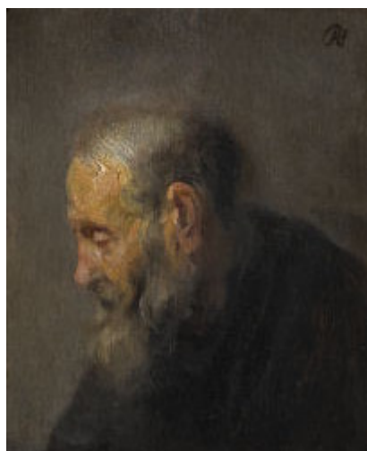
Estudio de un " Hombre Viejo en perfil ", c. 1630 aproximadamente 20 x 25 centímetro - de 8" x 10" de Rembrandt Van Rijn (1606-69)

A continuación las dos pinturas atribuidas a Rembrandt.