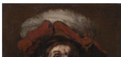
" El Cruzado ", c.1659-61, aproximadamente 60 x 80 centímetro - ése es 23 x 31" engrase en la lona El carro de mudanzas de Rembrandt Rijn (1606-69)

muestra del tablero de madera que la madera puede remontarse atrasado a Rembrandt por lo que se refiere a geografía y tiempo.